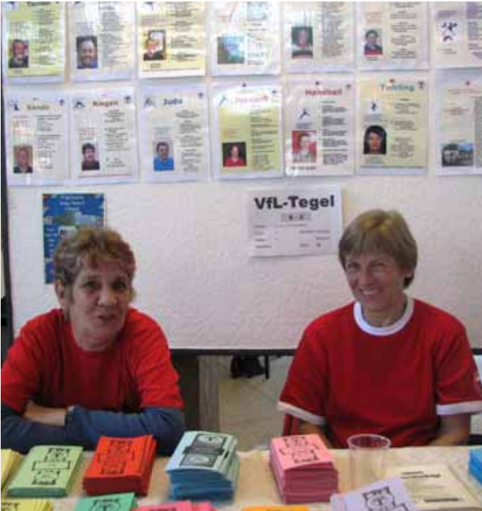
Helferpool im Rathaus Reinickendorf

Dienstag, 12. April 2011, 18.00 Uhr, Vereinsheim.